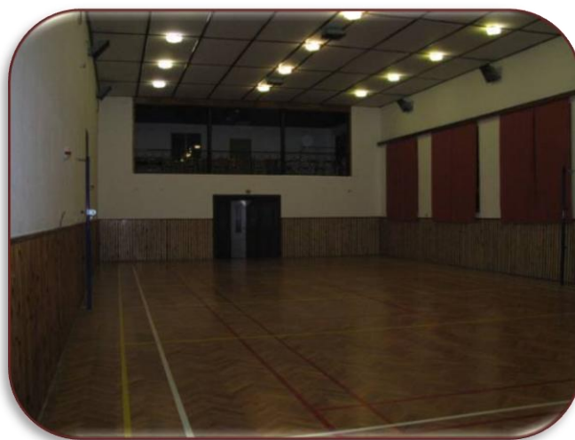
Pohled na nově zrekonstruovaný sál DSK Mikulovice.

Jak bylo již v úvodu tohoto zpravodaje zmíněno, obec uvolnila mimořádnou finanční částku ve výši 200 tis. korun na rekonstrukci vnitřních prostor DSK a sportovní vybavení. Nutné opravy a vyčištění kanalizačních vpustí si vyžádaly náklady ve výši 65 tisíc korun.