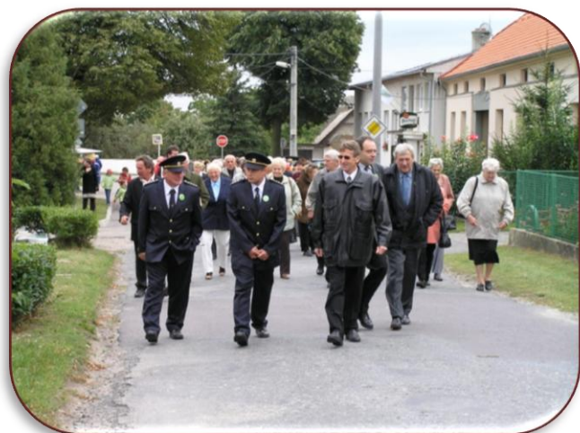
Průvod obcí při II. setkání rodáků v roce 2008