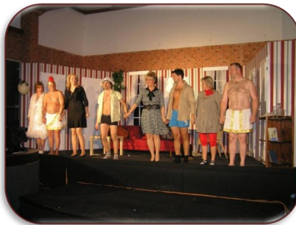
Divadelní představení souboru Kantoři z Mikulovic