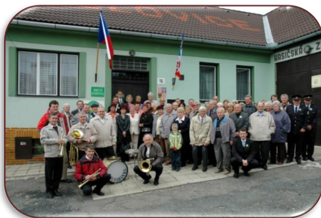
Setkání rodáků v roce 2008