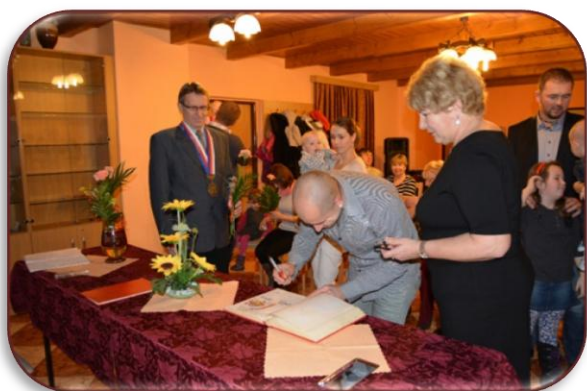
Vítání nových občánků