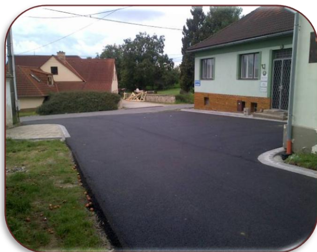
Nový asfaltový povrch před obecním úřadem