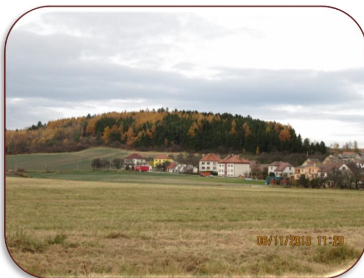
Mikulovická hora – 568 m n.m.