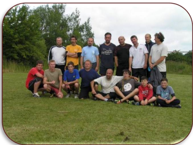
Pouť - fotbalové utkání ženatí – svobodní