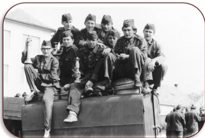
Archiv: ilustrační foto

Zapsal: Bohuslav Sovák dne 6. 12. 1942 v Mikulovicích