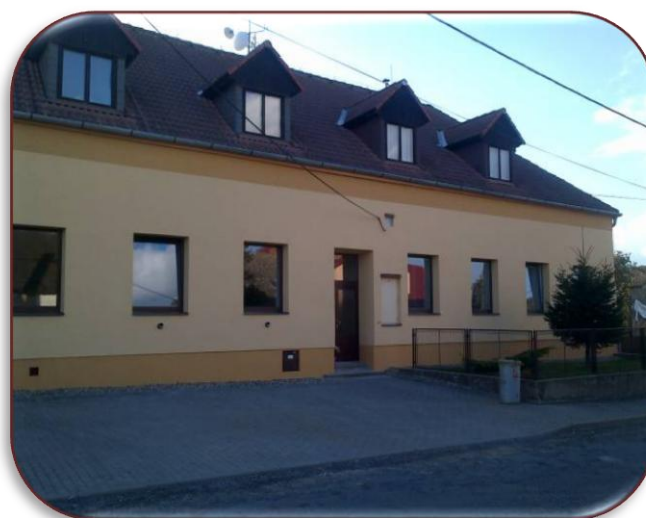
Nová fasáda bývalé školy