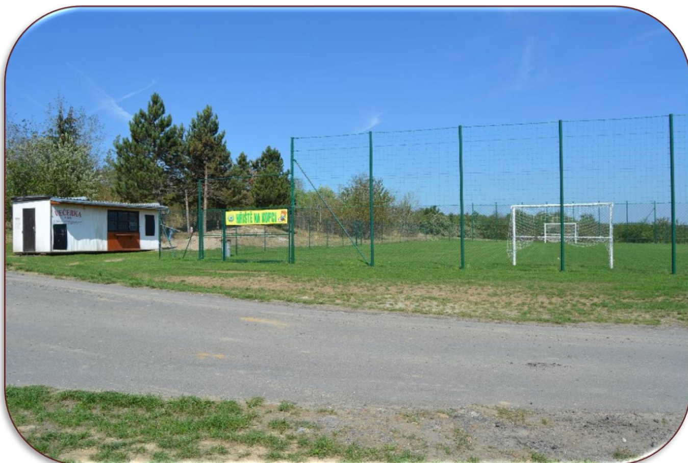
Hřiště na kopci