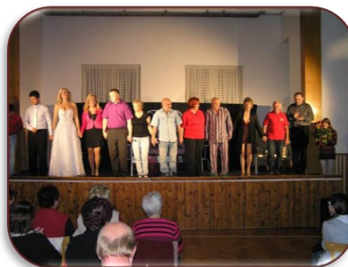
Vystoupení divadelního souboru „KANTOŘI“ z Mikulovic, okr. Jeseník