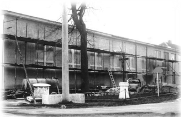
Fasáda na DSK