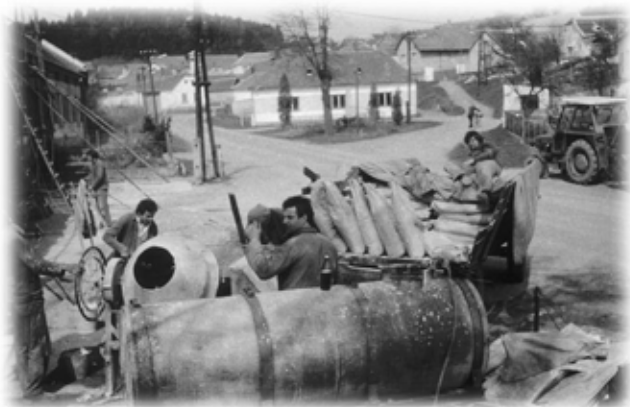
Brigáda při stavbě DSK