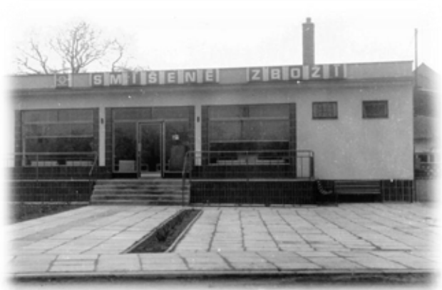
Nově otevřená prodejna Jednoty

Ale i dnes máme spoustu nových a zajímavých projektů, které stojí za zmínku.