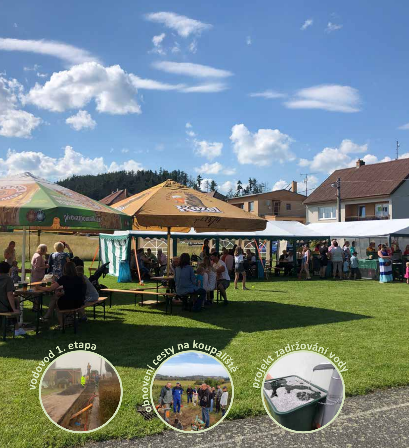
vodovod 1. etapa