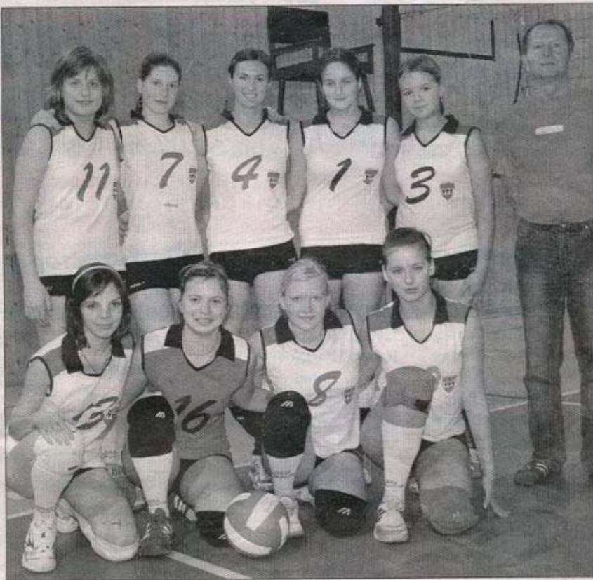
Kadetky TJ OA Třebíč zvládly druhé kolo Českého poháru na výběrnou a vrátily se do elitní osmičky soutěže.

Největší zájem byl však soustředěn na vystoupení domácího mužstva vedeného trenérem Petrem Fialou. Tým složený z hráček Žilkové, Hruškové, Němcové, Tesařové, Kunstové, Dimičové, Uhlířové, Jurákové a Veselé naprosto přesvědčivě prokázal, že patří mezi elitu českého mládežnického volejbalu. Děvčata se představila jako skvělá parta, která bojuje, i když se úplně nedaří, a v pěti sobotních a dvou nedělních utkáních ani jednou nezaváhala a své soupeřky porážela rozdílem třídy. Nejenže jako jediná ze všech týmů ani jednou neprohrála, ale dokonce neztratila ani jeden set. Dívky postupně porazily Hradec Králové, PVK Pře-